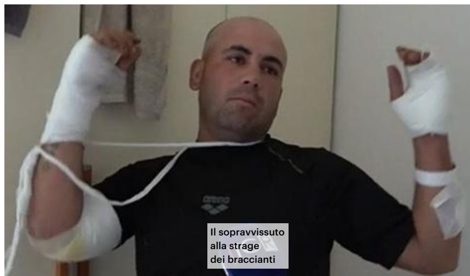
Il sopravvissuto alla strage dei braccianti